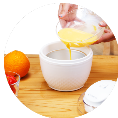
注ぎ口も大きくて使いやすい